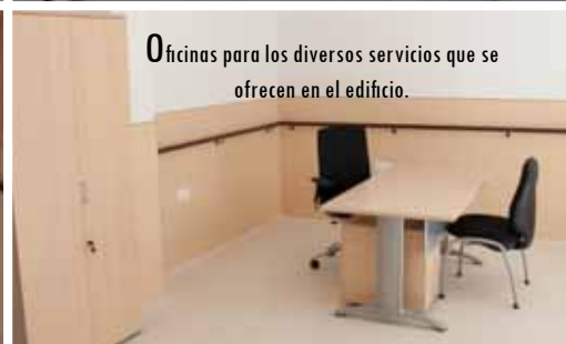
Oficinas para los diversos servicios que se ofrecen en el edificio.