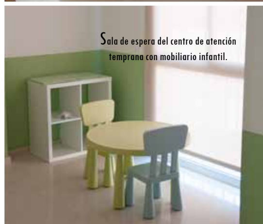
Sala de espera del centro de atención temprana con mobiliario infantil.