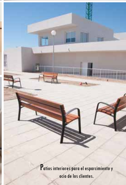
Patios interiores para el esparcimiento y ocio de los clientes.