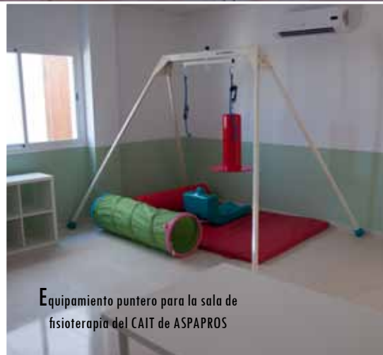
Equipamiento puntero para la sala de fisioterapia del CAIT de ASPAPROS