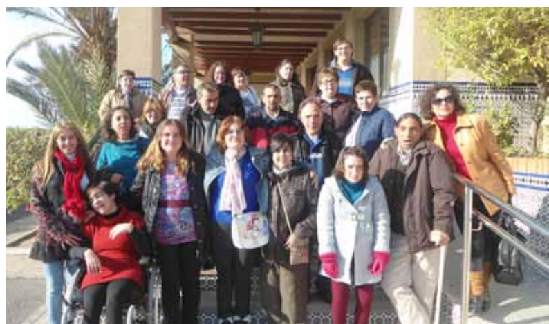
Autogestores de ASPAPROS en la puerta del hotel donde se celebró el encuentro provincial

"Toma el mando de tu vida" fue la ponencia sobre la que versó el encuentro, a cargo de un grupo de personas con discapacidad intelectual que cuentan sus propias experiencias.