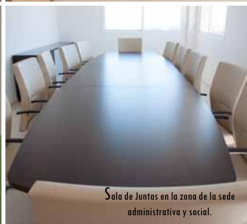
Sala de Juntas en la zona de la sede administrativa y social.