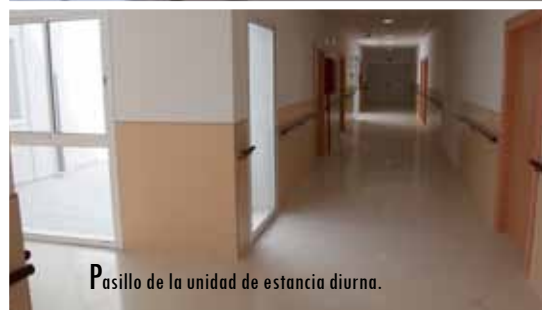
Pasillo de la unidad de estancia diurna.