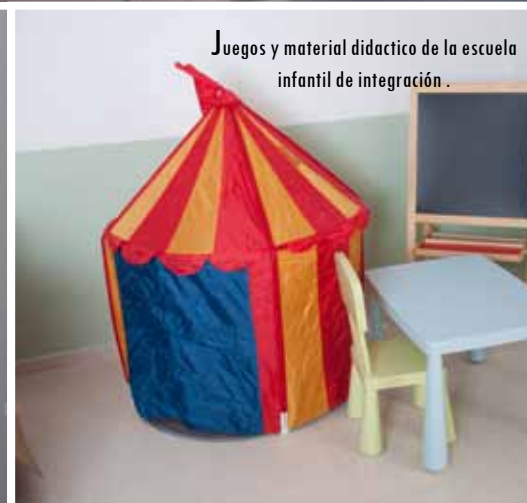
Juegos y material didáctico de la escuela infantil de integración.